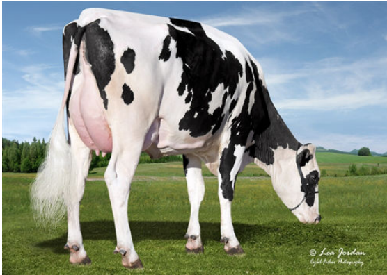
VANDOSKES DIECAST 3843