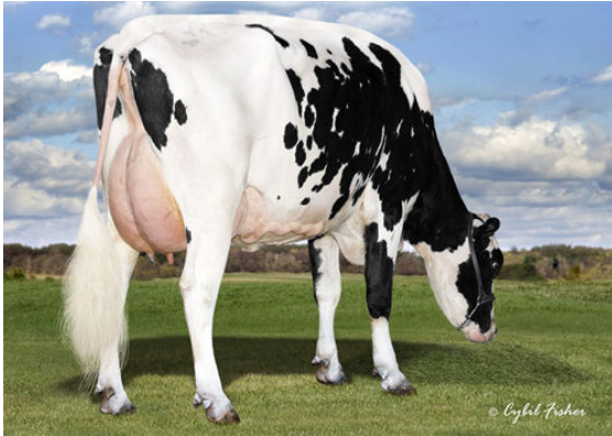
SCHREIBERDALE DIECAST 3597